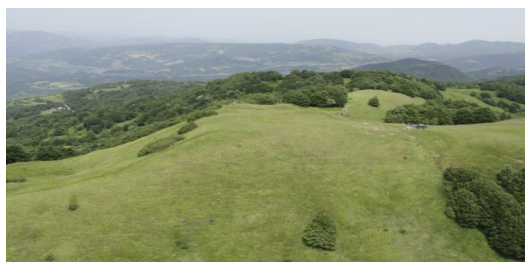
Sella di Monte Valoria

Camminando lungo il crinale Taro – Baganza in prossimità della Sella del Valoria, si ripercorre una via frequentata sin da epoca preromana, come mostra, fra le altre cose, la scoperta non lontano dalla sella di una discussa iscrizione. Giunti alla sella, ci si trova nel punto in cui, in