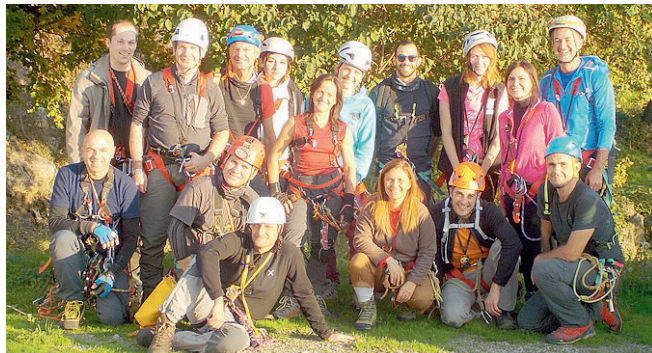
NEL VENTRE DELLA TERRA Il gruppo degli speleologi del Cai.

biente unico e incontaminato, rendendolo attrattivo al di là di ogni immaginazione. Se non sono ben resi conto i partecipanti del corso dello scorso anno, che hanno vissuto intensamente una vera esperienza ipogea, vivendo l'esperienza di entrata in grotta, alternata alle lezioni in aula. Le fasi didattiche di progressione in libera e su corda nell'ambiente sotterraneo rappresentano un fondamento